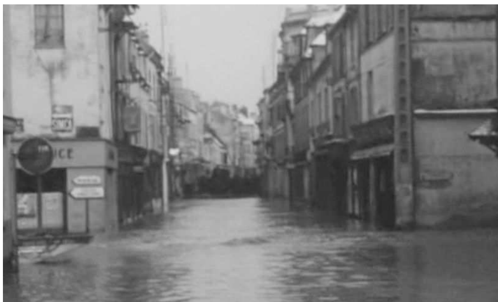
Crue de 1958 dans Coulommiers

« LA DÉFINITION QUE JE DONNE DU RISQUE MAJEUR, C'EST LA MENACE SUR L'HOMME ET SON ENVIRONNEMENT DIRECT, SUR SES INSTALLATIONS, LA MENACE DONT LA GRAVITÉ EST TELLE QUE LA SOCIÉTÉ SE TROUVE ABSOLUMENT DÉPASSÉE PAR L'IMMENSITÉ DU DÉSASTRE ».