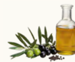
2 cuillères à soupe d'huile d'olive