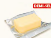
40 g de beurre demi-sel à température ambiante